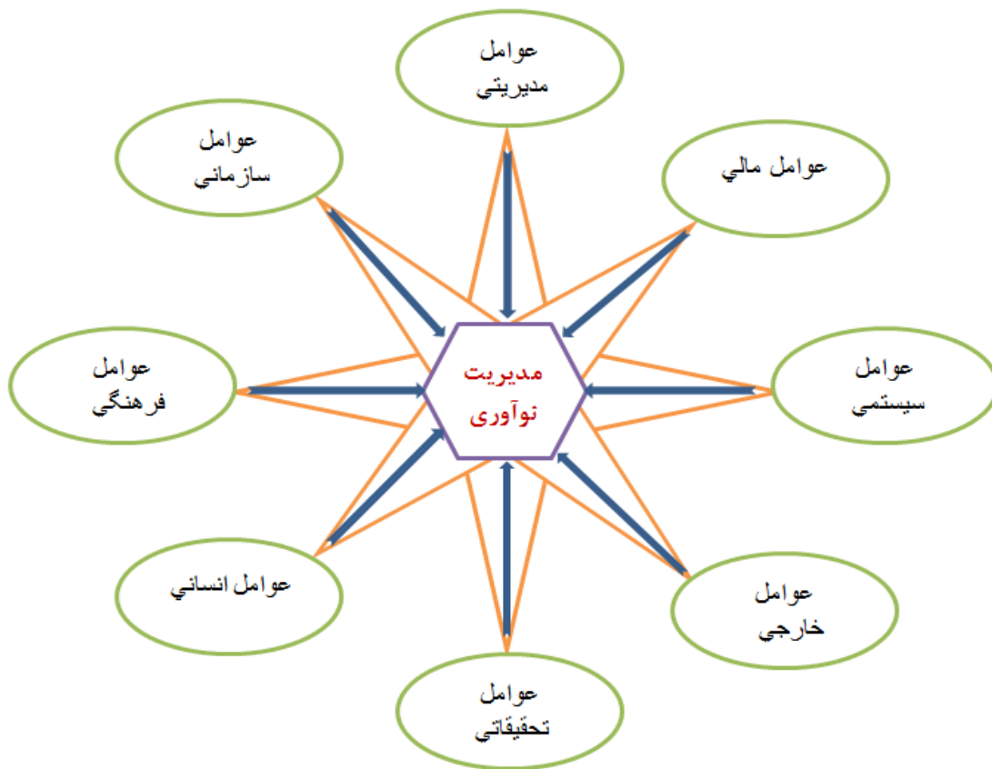
شکل ۱: مدل مفهومی تحقیق

تعداد به ۶۰ شاخص مهم‌تر و موثرتر تعدیل و در نهایت با استفاده از روش معادلات ساختاری و اعتبارسنجی مدل با نرم‌افزار PLS و حذف ۵ شاخص، مدل نهایی با ۸ عامل و ۵۵ شاخص مورد تأیید قرار گرفت. این شاخص‌ها در ۸ بعد دسته‌بندی گردید که در جدول شماره ۲ به تفکیک ابعاد و عوامل دسته‌بندی شده مشاهده می‌گردد.