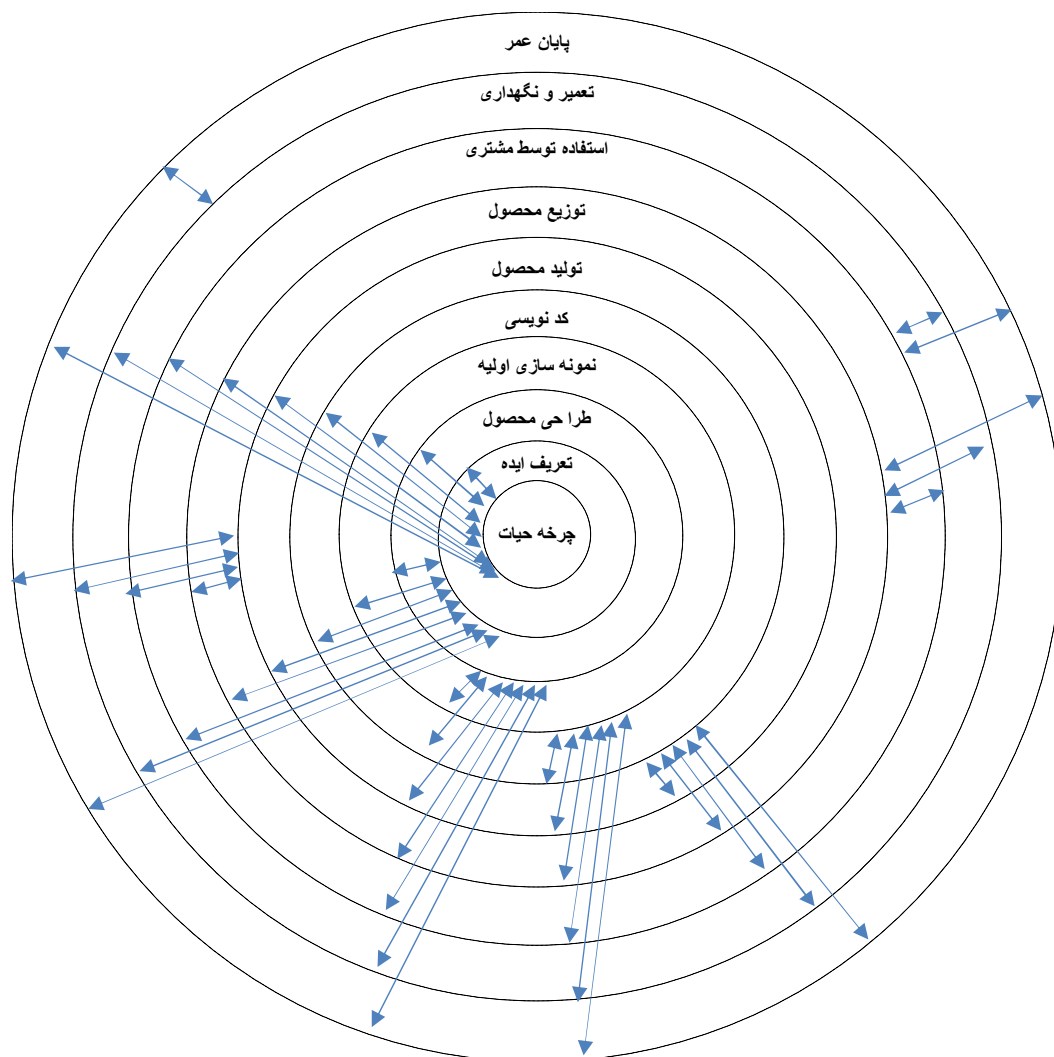
شکل ۲: مدل مفهومی تحقیق بر مبنای تکنیک دیمتل

با توجه به هدف تحقیق که شناسایی روابط علی میان مراحل چرخه حیات سیستم‌های اطلاعاتی بوده و با توجه به مراحل اجرای کار و شاخص‌های موجود در جدول شماره یک، می‌توان