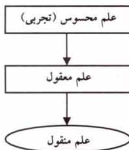
نمودار شماره ۲، ترتیب و سلسله مراتب علوم در توسعه موجود