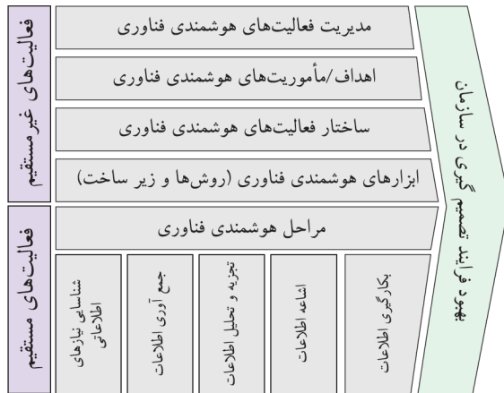
شکل ۲: نظام هوشمندی فناوری [۱۴]

اهداف هوشمندی فناوری ۳۷ ، ساختار هوشمندی فناوری ۳۸ و ابزار هوشمندی فناوری ۳۹ [۱۴]. نظام هوشمندی فناوری مورد بحث، در شکل شماره دو نمایش داده شده است.