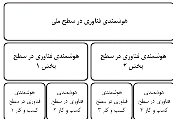
شکل ۱: سطوح مختلف هوشمندی فناوری [۲۲]

از طرفی، فرآیندهای برنامه‌ریزی و تصمیم‌گیری می‌تواند دارای سطوح مختلف ملی ۲۹ ، بخشی ۳۰ و کسب‌وکار ۳۱ باشد. فعالیت‌های هوشمندی فناوری نیز در سطوح مختلف قابل تعریف، کاربرد و بهره‌برداری است که مهم‌ترین این سطوح شامل سطح شرکت و کسب‌وکار، سطح صنعت یا بخش و سطح ملی می‌باشد [۲۲]. سطوح مختلف هوشمندی فناوری در شکل شماره یک نشان داده شده است.