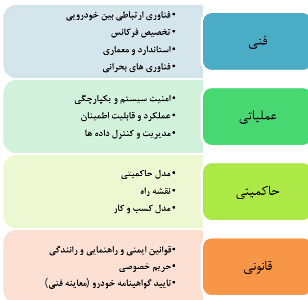
شکل 2: ابعاد چالش‌ها و الزامات فناوری ارتباطات هوشمند خودرویی

شکل شماره 2، ابعاد چالش‌ها و الزامات فناوری ارتباطات هوشمند خودرویی را نشان می‌دهد.