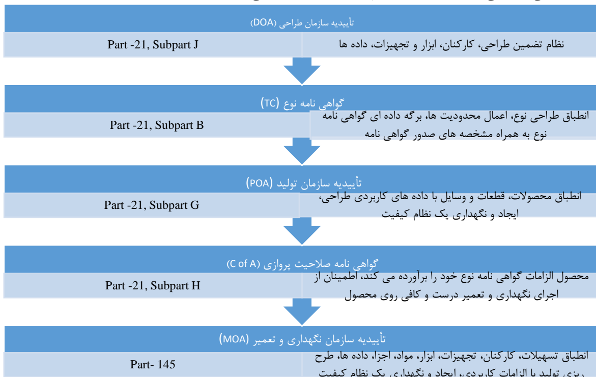
شکل ۱: نقش استانداردها و گواهی‌نامه‌های مختلف برای عملکرد ایمن یک وسیله پرنده مبتنی بر مقررات CAO.IRI

از میان ۱۹ ضمیمه منتشرشده، ضمیمه ۸ به بحث صلاحیت پروازی می‌پردازد. وزارت دفاع انگلستان تعریف گسترده‌ای از صلاحیت پروازی ارائه می‌کند: "توانایی وسیله پرنده یا سایر تجهیزات یا سامانه‌های هوانوردی به‌منظور کارکرد بدون خطر جدی برای خدمه هوایی، خدمه زمینی، مسافران یا عموم مردمی که این سامانه‌ها روی سر آن‌ها پرواز می‌کنند" [۲۳] . استانداردهای صلاحیت پروازی شامل استانداردهای فنی در تمامی جنبه‌های طراحی، فناوری، نگهداری و تعمیر و همچنین استانداردهای ایمنی وسیله پرنده هستند تا بتوان از پیاده‌سازی صلاحیت پروازی وسایل پرنده اطمینان حاصل کرد. طبق تعریف اداره هوانوردی فدرال (FAA) ۳۵ ایالات متحده، اصطلاح "صلاحیت پروازی" به شرایطی گفته می‌شود که در آن وسیله پرنده ضمن