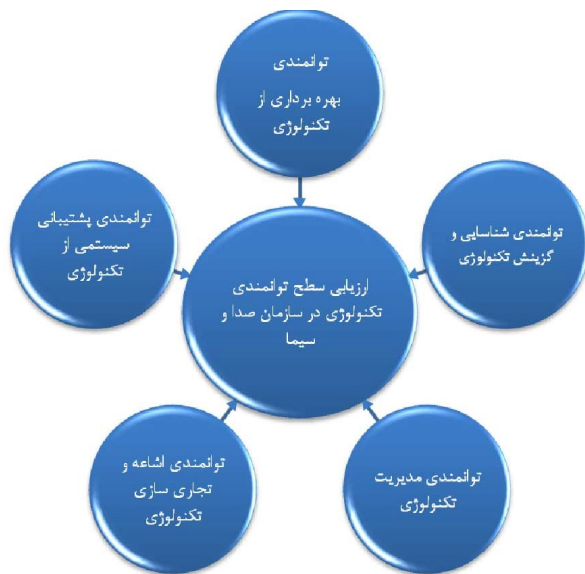
شکل ۱: مدل ارزیابی سطح توانمندی فناوری برآزش شده در سازمان صداوسیما [۱۰]

جهت ارزیابی شاخص‌های توانمندی فناوریانه در سازمان صداوسیما از مدل بومی شکل شماره ۱ که براساس پژوهشی اختصاصی توسط خمسه و رمضانی (۱۳۹۵) حاصل گردیده، استفاده شده است.